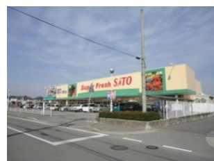
スーパー目の前！ 買物超便利～！